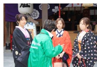
(第3班博多まち歩き体験)