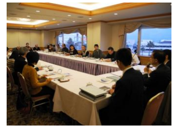
(鹿児島県の教育旅行最新情報説明)

すでに修学旅行を九州で実施している学校を始め沖縄など他の方面で実施している学校からも、今後の修学旅行の方面を検討するに当たり大変参考になった、との意見を多くいただきました。また、今後も今回のような現地視察会の継続実施について要望がありました。