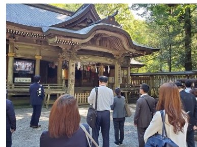
高千穂神社 (宮崎県)