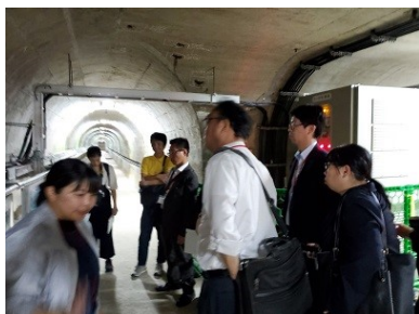
鶴田ダム (鹿児島県)

関西・中国地区の旅行会社社員 19 名を招へいし、現地視察研修を行いました。霧島や高千穂など定番の地域に加え、TRY!九州キャンペーン着地型商品(開発中含む)や、特急はやとの風(貸切運行)の乗車など、現在の九州ならではの素材の体験を行いました。参加者の大半が南九州を訪れた経験がなかったため、位置関係含め今後の旅行商品造成・販売への参考になるという感想が多く寄せられました。九州への誘客拡大に向けて引き続き視察等現地情報の発信に努めてまいります。