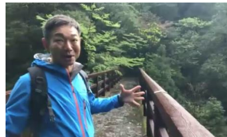
霧雨で神秘的な空間を醸し出す「ヤクスギランド」