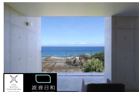
屋久島ブルーが部屋から一望できる「波音日和」