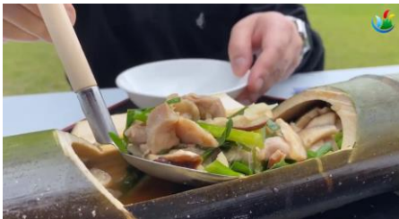
地鶏とニラを青竹に入れて作った絶品「かっぱ鶏」