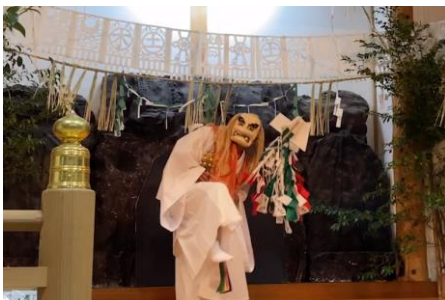
高千穂のスピリチュアルを直に感じられる「夜神楽」