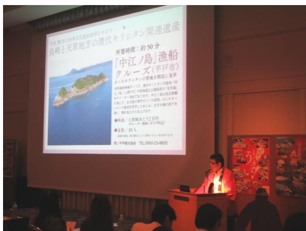
第 1 部