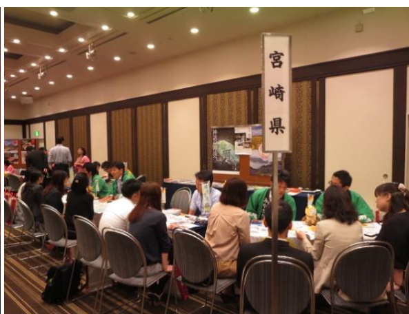
第 2 部