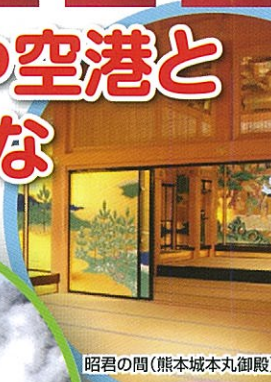
昭君の間 (熊本城丸御殿)