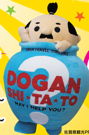
佐賀県観光PRキャラクター壺侍