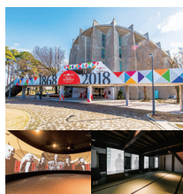
幕末維新記念館 (市村記念体育館)

Hizen Saga Bakumatsu-Meiji Restoration Expo