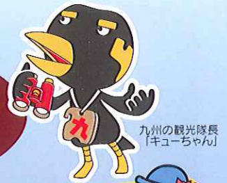
九州の観光隊長 「キューちゃん」