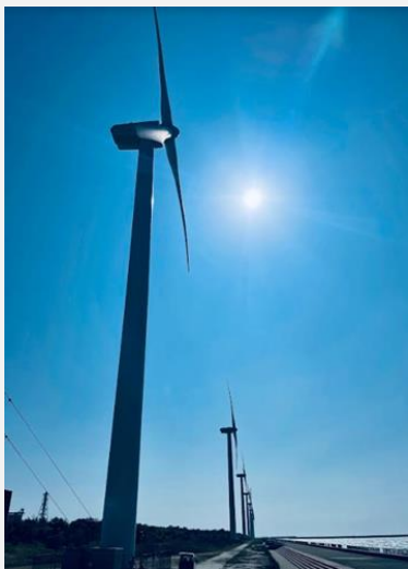
北九州市エコタウンセンター