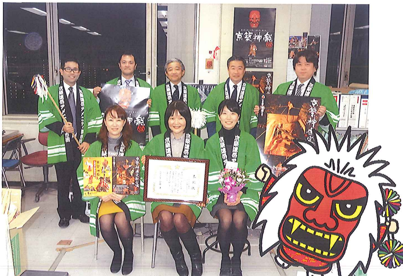
京築神楽イメージキャラクター みさきくん